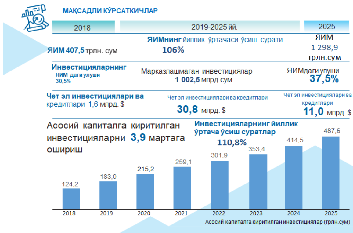
2-rasm. Asosiy kapitalga kiritilgan investitsiyalar(trln.so‘m) 9

samaradorligini oshirish, samarali chora-tadbirlarni amalga oshirish va xorijiy investitsiyalarni jalb qilishning yangi yondashuvlarini ishlab chiqish aniqlangan.