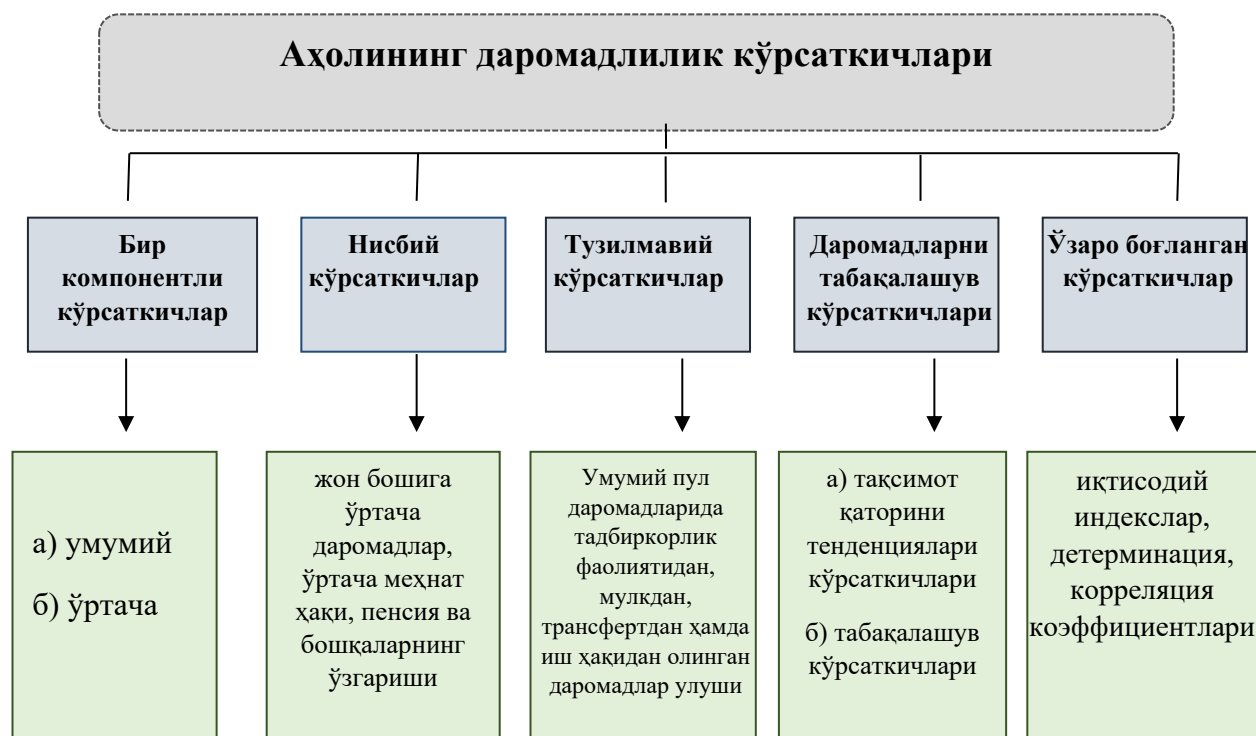
2-расм. Аҳоли даромадлигини таҳлил қилиш учун статистик кўрсаткичлар тизими

шакллантирилади. Бу эса статистик кўрсаткичлар тизимини такомиллаштиришни тақозо этади. Шу боис аҳоли даромадлигини таҳлил қилиш учун статистик кўрсаткичлар тизими таклиф этилди (2-расм).