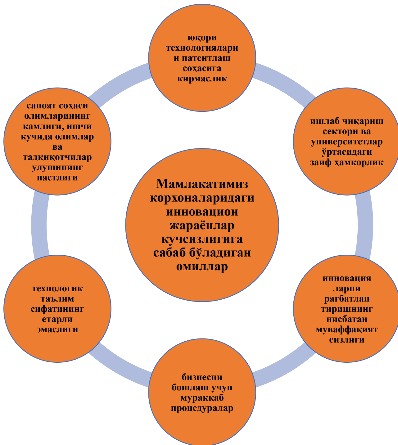
2-расм. Мамлакатимиз корхоналаридаги инновацион жараёнлар кучсизлигига сабаб бўладиган омиллар