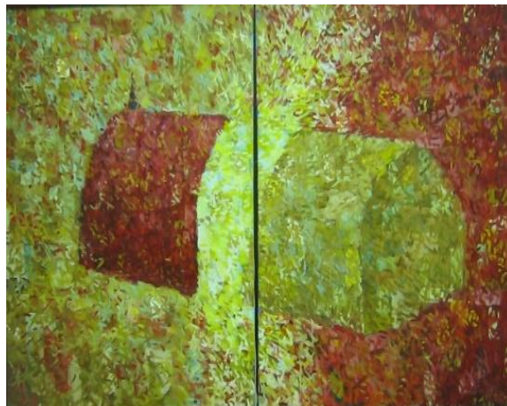
4-rasm. “O'xshash manzillar” 2006-y