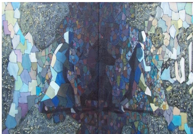
3-rasm. “Hikmat” 2005-y.