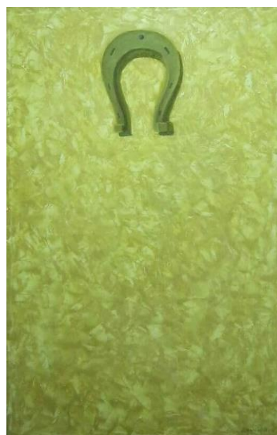
5-rasm. “Ishonch” turkim 2011-y.