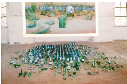
А.Николаев. “Орол суви” Инсталляция 2005 йил.

Кўрғазмада тиллар, техник воситалар ва жанрлар, нафақат экспериментал, балки рассомларнинг жиддий фалсафий ишларини ҳам тақдимоти бўлди. “А.Николаевнинг “Орол суви” инсталляцияси нафақат экологик ҳалокат ҳақида, балки антропосентрик ғояларнинг барбод бўлиши ҳамдир”. (3, с.23-25) Дарҳақиқат, ушбу “Орол суви” инсталляциясида шиша идишларга минерал сув солинган. Баъзи идишлар синган. Томошабинлар сувдан ичиши мумкин. Бу билан рассом Оролнинг қуришига инсонлар ҳам сабабчи эканига ишора беради. Ёки кинетик лойиҳасидан “Комилликка интилиб” асарида рассом гипсдан ясалган қўлларни қоғозга инсон қоматини давомли тарзда муҳрлашини ифода этади. Яъни комиллик бугунги кунда қай даражада эканлигини киноя орқали ифодалайди.