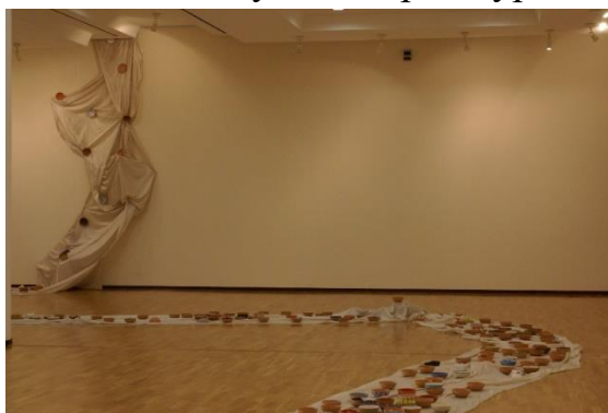
С.Жабборов. “Тақдирлар оқими” Инсталляция 2008 йил

“CONSTELLATION” лойихаси ҳам экспериментал ҳам профессионал тарзда актуал санъатнинг мувоффақиятини очиб берди. Шунда сўнг бу йўналишда кўплаб лойихалар амалга оширила бошлади. С.Жабборов, Д.Розиқов, Н.Шарафхўжаева, Н.Расулов ва Ш.Ражамовлардан ташкил топган “5+1” гуруҳи ўзларини ишларни тез-тез намоиш этмоқдалар. Хусусан С.Жабборовнинг “Тақдирлар оқими” инсталляциясида шарқ шоирларинг хикматли сўзларини сопол идишларга ёзади ва ахлоқий муаммоларга мурожаат қилади.