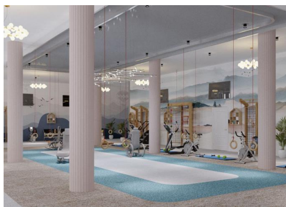
1-rasm. Interyerlarda maxsus yordamchi vositalar va yechimlar.

Nogironligi bor insonlarni turmush hamda harakatlanish sharoitlarini yanada zamonaviylashtirish orqali ularni boshqalar bilan tengma teng harakatlanishlari, jamoat joylarida erkin aloqaga kirishlarida yana ham imkoniyat yaratadi. Quvonarlisi bugungi kunga kelib bunday binolarni loyihalash ko‘lami oshmoqda. Ya’niy zamonaviy hamda kirativ binolar ko‘payishi bilan hamma jamiyat azolari birdak harakatlanishlarini taminlashi bu quvonarli.