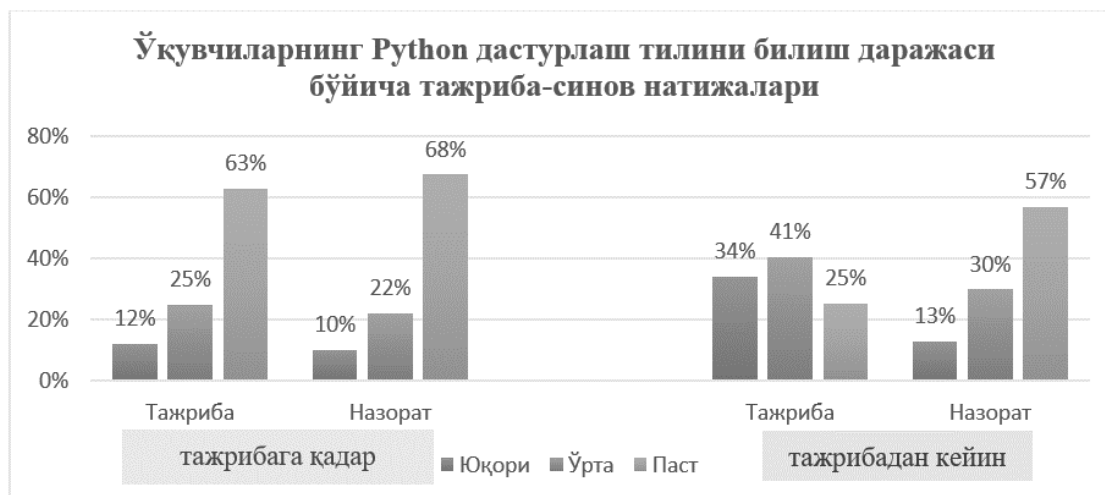
3-расм. Ўқувчиларнинг Python дастурлаш тилини билиш даражаси бўйича тажриба-синов натижалари