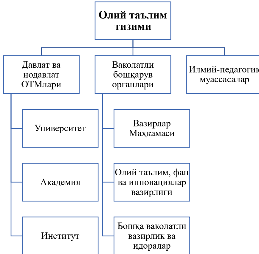
1-чизма. Ўзбекистонда олий таълим тизимининг ташкилий тузилиши.

таълим муассасалари томонидан тақдим этиладиган ўрта таълимдан кейинги босқичдаги барча турдаги таълим, ўқитиш ёки илмий тадқиқот турлари»ни ўз ичига олади [1].