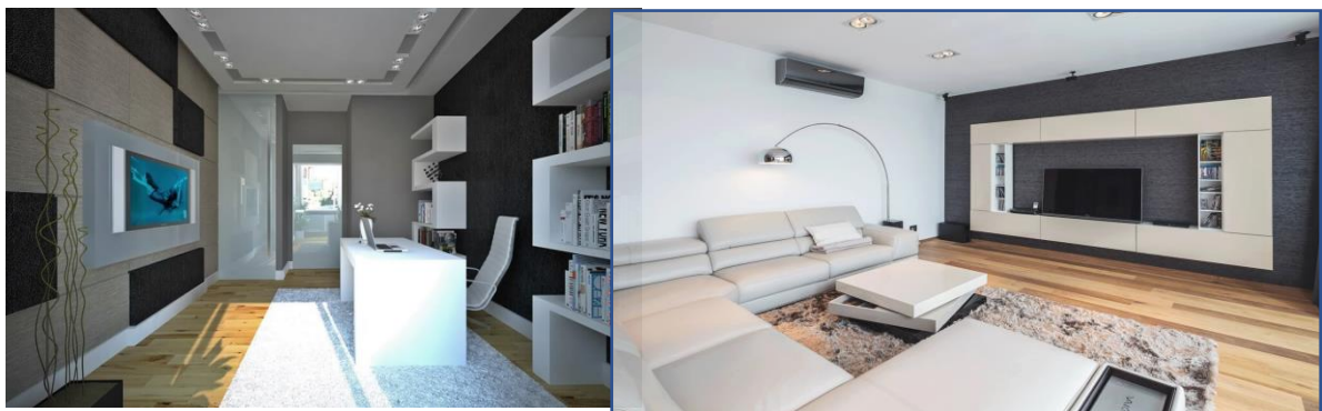
3-rasm. Funksionalizm uslubidagi interyer

Mustahkamlikni yaxshi ko‘rasizmi? Sizga tartib va narsalarning qulay joylashuvi yoqadimi? Ehtimol, sizni klassik uslublarga xos bo‘lgan interyerlar, dekorativ jihatdan jim-jimador bo‘lgan interyerlar qiziqtirmas... Agar siz hayot tarzingizda ortiqcha bezaklardan holi bolgan, sodda makonni xush ko‘rsangiz interyerda funksionalizm uslubi sizni qiziqтира olishi shubhasiz.