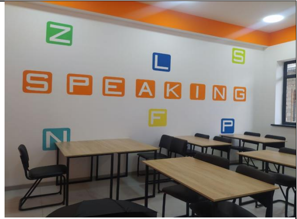
4-rasm. Dars o'tish xonasining issiq ranglar echimi

Atrof-muhit uchun ranglar palitrasini tanlashda talabalarning aniq yosh guruhini hisobga olish juda muhimdir. Ikki yoshdan to‘rt yoshgacha bo‘lgan maktabgacha yoshdagi o‘quvchilar va besh yoshdan o‘n yoshgacha bo‘lgan boshlang‘ich maktab o‘quvchilari issiq va yorqin ranglarni afzal ko‘rishadi. Ranglar jadvalining issiqroq qismini egallagan qizil, to‘q sariq va sariq ranglar kichkintoylarning ekstrovert tabiatini muammosiz to‘ldiradi. Boshqa tomondan, o‘n bir yoshdan o‘n uch yoshgacha bo‘lgan o‘rta maktab o‘quvchilari va o‘n to‘rt yoshdan o‘n sakkiz yoshgacha bo‘lgan o‘rta maktab o‘quvchilari engil va xotirjam ohanglarga moyil. Moviy, yashil va binafsha ranglar bolalarning bolalikdan kattalikka o‘tish davrida dam olish va diqqatni jamlash qobiliyatiga ega bo‘lgan ranglar jadvalining sovuqroq qismini o‘z ichiga oladi. Ta’lim jarayonida ranglarning xususiyatlarini quyidagicha ifodalash munker: