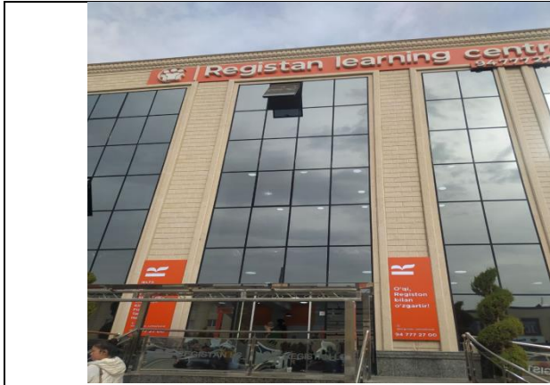
3-rasm. Bino fasadi